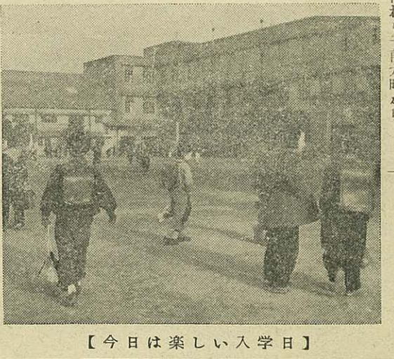
【今日は楽しい入学日】

昭和三十一年度市内小中学校入学式の期日が次の通り決定しましたのでお知らせ致します。 小学校……四月九日 中学校……全七日 伊万里市教育委員会