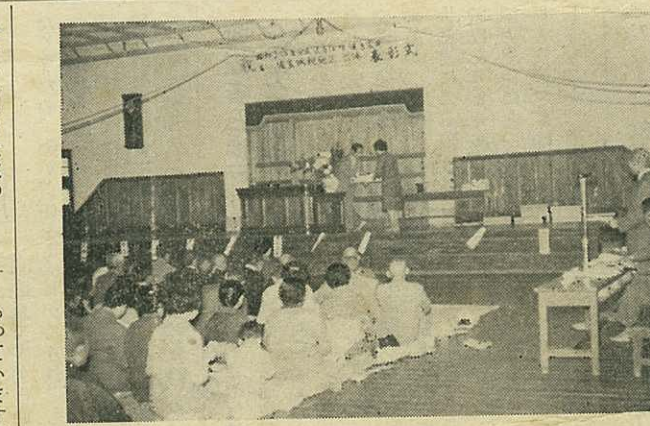
大坪小での表彰式

健康家庭などを表彰 一家がそろつて健康に留意され一度も診療を受けたことがなく、しかも保険税を完納下さつた健康家庭の表彰式が去る十月四日大坪小学校講堂で開かれ、その体制が確立されてきたのも、みなさんのご協力のおかげです。