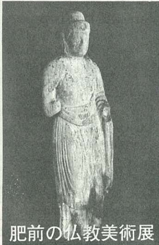
肥前の仏教美術展

犬や猫を飼う資格がないのではないか。他人の迷惑にならない飼いに主になつてほしいものである。 指摘されるまえに注意してほしい。