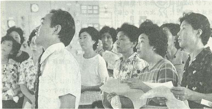
▶上水道施設の説明をきく消費者グループ◀

昭和49年度から財源不足となっています。これまでの料金（47年頭初決定）でいくと、昭和52年度末で上水道は4億9,000万円、簡易水道は5,300万円の赤字が見込まれる事態となつてまいりました。