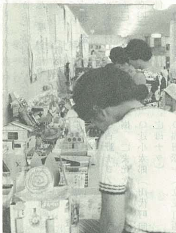
▶ 1,500点が出品された作品展 ◀

今年で11回目の伊万里市小・中学校夏季作品展（主催＝市教育研究会）が、9月12日から16日まで