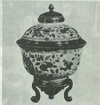
▶染錦・地文草花図小蓋物◀