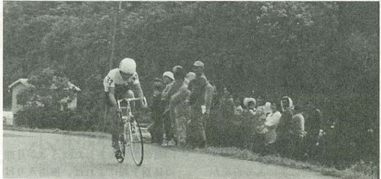
▶声援にこたえて力走する選手（波多津町木場）◀

道路の清掃奉仕や大会当日の湯茶接待をいただきました。また、警察官・交通安全指導員・消防団員