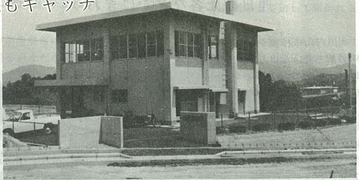
▶ 市庁舎の隣りに完成した統計情報事務所 ◀