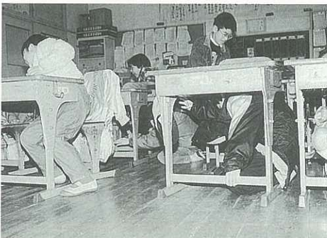
● 伊万里小学校では全校生徒による地震避難訓練（2月18日）

山：ハイキングや登山をしている最中に地震にあつたら、山崩れや山津波にあう可能性ががあります。地震のあとの雷鳴のような音は山津波の前兆。まず横方向に逃げるのが最善策です。