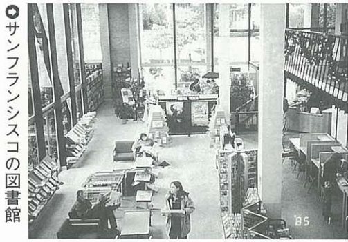
○サンフランシスコの図書館

おり、それを支える一般市民のボランティア活動がいかに行き渡っているか、について報告されました。また、図書館ボランティアを視察した3人からは、図書館があらゆる面で市民生活に密着しており、図書館職員をサポートして案内サービスや資金集めのバザーを開く図書館友の会などで活躍するボランティアの活動実態が報告されました。