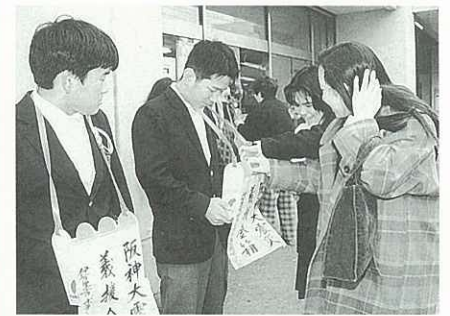
市ボランティア連絡協議会は街頭募金活動

などに置いた募金箱や、市ボランティア連絡協議会が行った街頭募金、市民センターでの行事の際の募金など、市民のみならずから寄せられた救援金のうち2月14日までの分です。 救援金は、全額が募集委員会によって被災者へ支給されます。