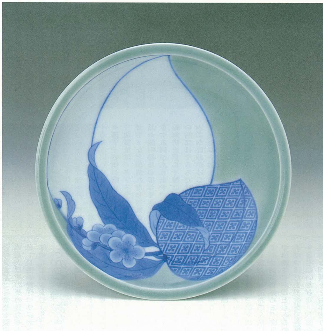
◆20世紀を文化で飾る