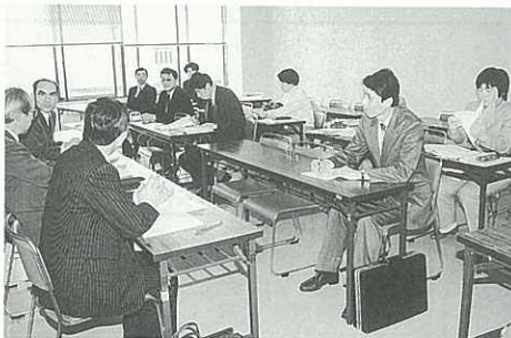
○いじめ等対策委員会の小委員会が発足

すでに、1月24日にはその小委員会が発足して、現在、「いじめ」に関するアンケート調査結果の考察などの作業が進められています。今後は、その考察結果をもとに指導方針を決め、各小中学校に対し必要な助言や指導を行うことにしています。