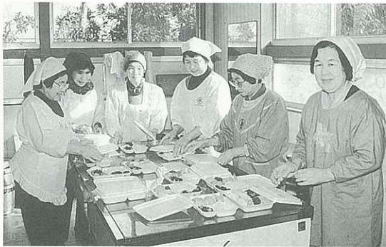
○二里公民館でのお弁当づくり

お年寄りたちは、月に一度のお弁当を大変楽しみにしています。このため、早速、民生委員の人たちはできたてのお弁当を手にお持ち地区のお年寄りへ配達にと出かけました。