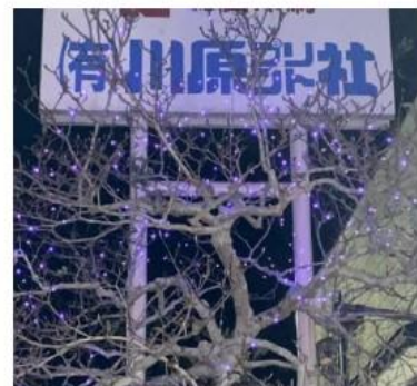
有限会社 川原プリント社