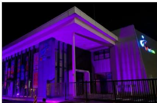
伊万里ケーブルテレビジョン株式会社

✿「女性に対する暴力をなくす運動」期間を中心に、全国で「女性に対する暴力をなくす運動」のシンボルカラーのパープルライトアップが行われました。伊万里市では「伊万里ケーブルテレビジョン株式会社」、「株式会社くすきの杜」、「有限会社 川原プリント社」の3社にご協力いただきました。