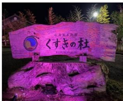
株式会社 くすきの杜