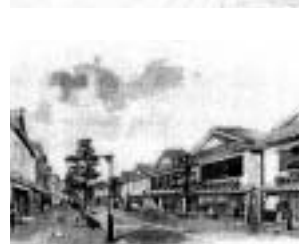
伊万里を感じる街並みイメージ