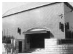
戸栗美術館(東京都渋谷区)

生産活動の面で伊万里の元気を支えている市内の企業活動に対する理解、関心を促すとともに、新たな観光資源としての可能性をさぐるために造船所など市内企業の見学会を実施するなど、既存の観光資源と組み合わせた産業観光の開発にも取り組めます。