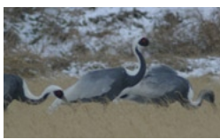
長浜干拓に飛来したツル

『焼き物の里いまり』をアピールするため、市街地の道路沿いなどに陶磁器を利用したミニユメントを設置します