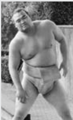
朝稽古をする高見盛関 11.8：国見台相撲場