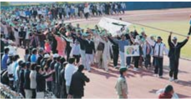
2115人が元氣よく、みごとに入場行進を行いました