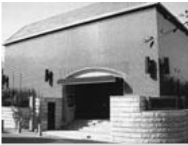
日本でも数少ない陶磁器専門の戸栗美術館（東京都渋谷区）