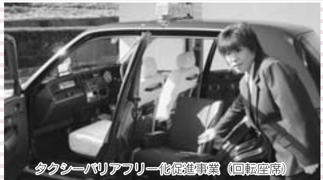
タクシーバリアフリー化促進事業（回転座席）

『既に実施している』件数は、平成12年度135件中100件（74.1%）が、平成16年度137件中124件（90.5%）となり、24件（16.4%）の新規事業に取り組みました。