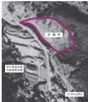
伊万里有田焼伝統産業会館