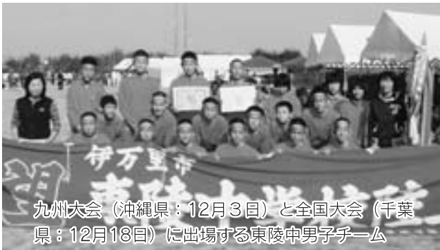
九州大会（沖縄県：12月3日）と全国大会（千葉県：12月18日）に出場する東陵中男子チーム

佐賀県中学校駅伝大会が、11月8日、杵島郡白石町福富マイランド公園コースを会場に開かれました。