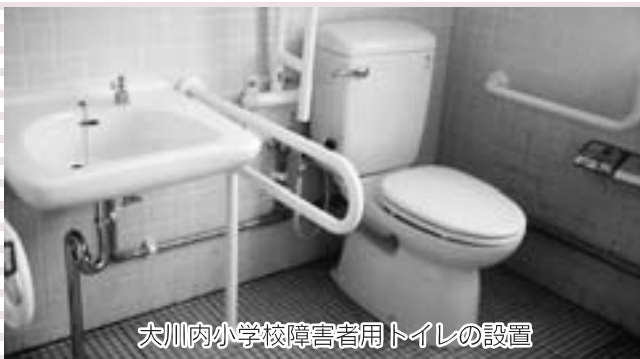
大川内小学校障害者用トイレの設置

『既に実施している』件数は、平成12年度347件中248件（71.5%）が、平成16年度363件中319件（87.9%）となり、71件（16.4%）の新規事業に取り組みました。