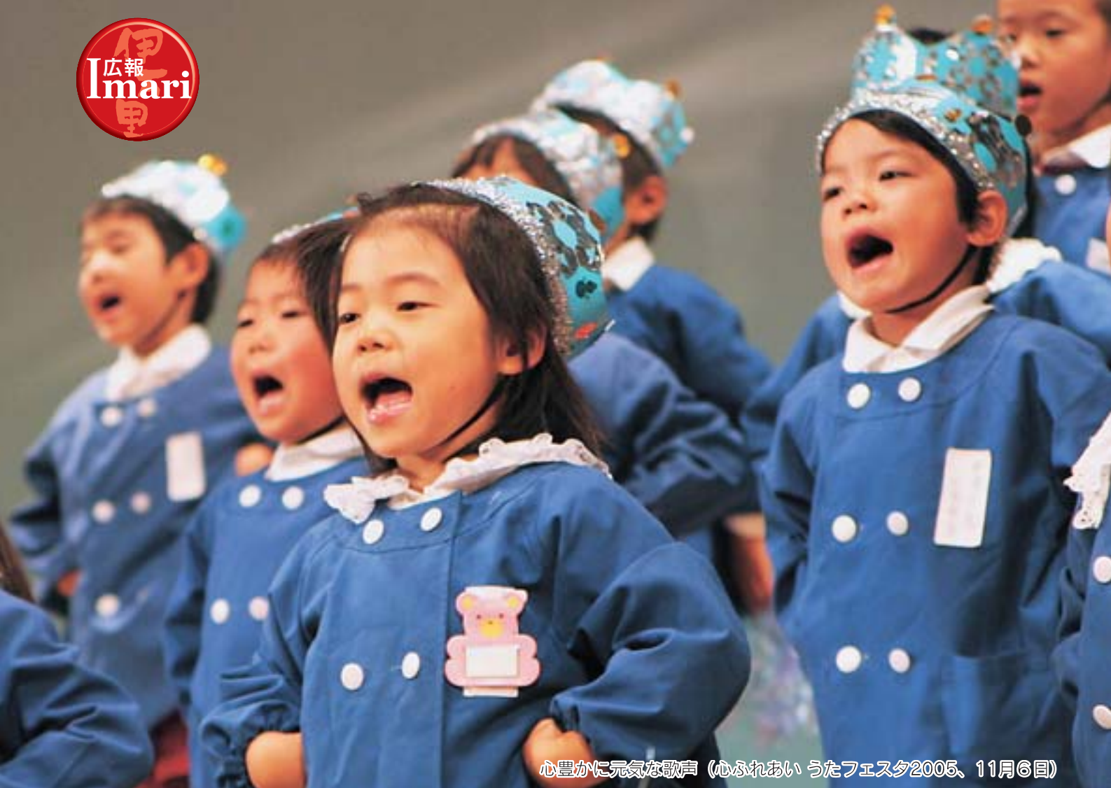
心豊かに元気な歌声 (心ふれあいうたフェスタ2005、11月6日)