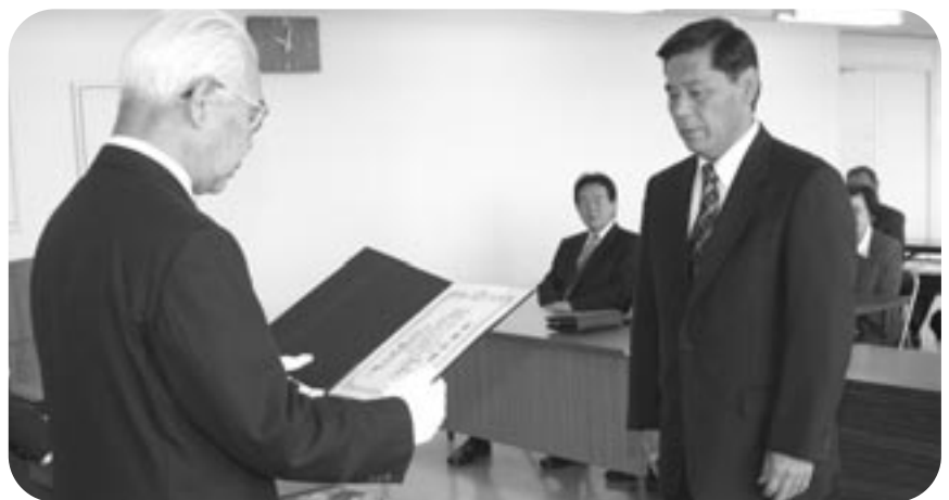
当選証書の付与 (市役所大会議室 4月25日)

1人、社民党1人、共産党1人、無所属21人で、男女別は男性22人、女性2人となっています。 投票率は、過去最低だった前回選挙を下回る74・39パーセントでした。 投票結果は次のとおりです。(2ページに新議員24人を紹介しています)