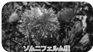
ソムニフェルム種

不正けしの栽培は、あへん法第4条などで禁止されていますが、昨年市内の数カ所で不正けしが確認されています。