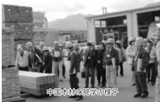
中国木材の見学の様子