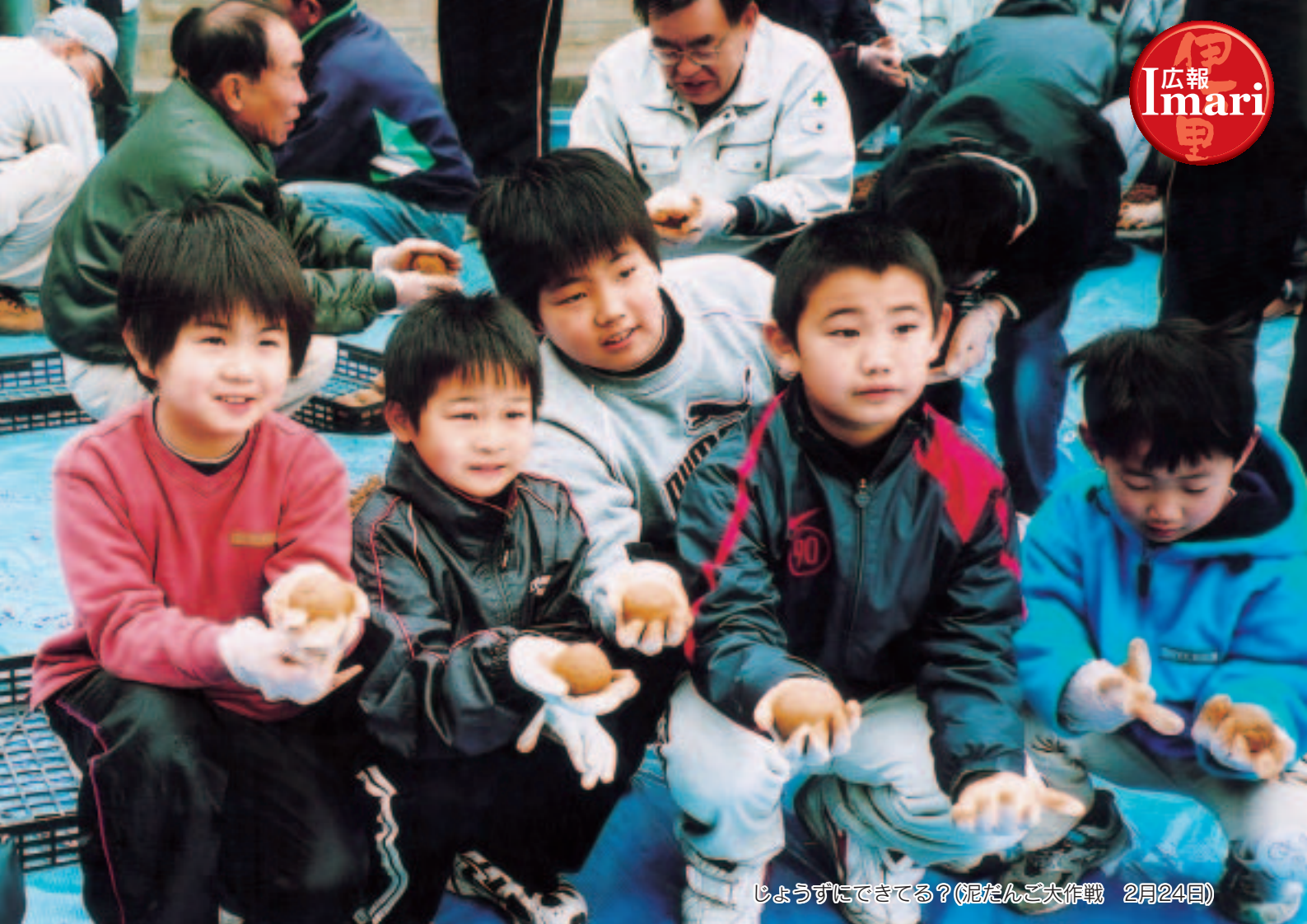
じょうずにできてる？(泥だんご大作戦 2月24日)