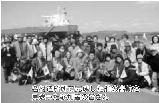
名村造船所で完成した船の出航を見送った参加者の皆さん