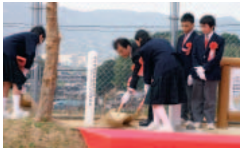
タイムカプセルを基準点(右)の横に埋設している生徒代表。

西九州自動車道ができると、遠くに住んでいる人に、短い時間で会いに行ける。それは、会っている大切な時間が長くなること。こんな明るく楽しい生活がしたい。