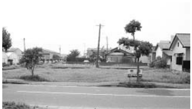
2 二里町八谷搦字伊万里二本松227番11の宅地