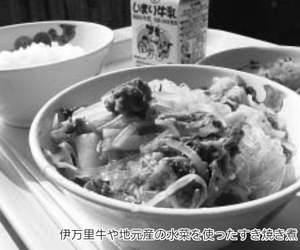
伊万里牛や地元産の水菜を使ったすき焼き煮

これは、子どもたちに学校給食を通して、地域の農林水産業への理解を深めてもらい、また、伊万里産品の消費拡大と地産地消を推進するために実施されます。