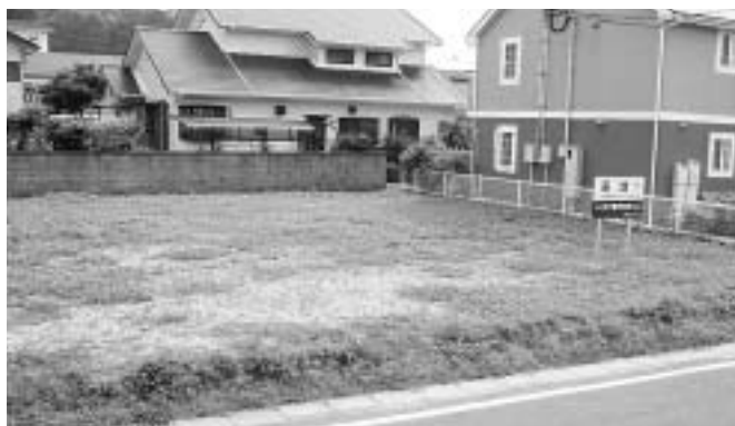
1 脇田町字川久保3430の宅地