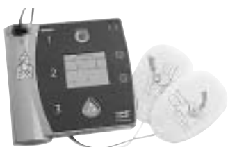
AED (自動体外式除細動器)

また、最近では『AED』という言葉が耳にされると思いますが、心臓の動きが止まった人に電気ショックを与える器械のことです。この器械は、一般市民の方でも規定の講習を受ければ使用することができます。市内の各町公民館など公共施設30か所に設置していますので、講習を受けているといざという時にお役に立ちます。AEDや応急手当などの講習は随時受け付けていますので、お気軽にお問い合わせください。