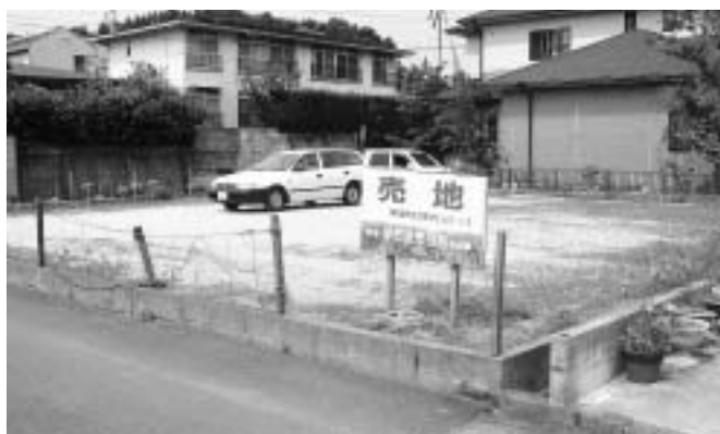
3 大坪町字葉蓋甲2443番115の宅地