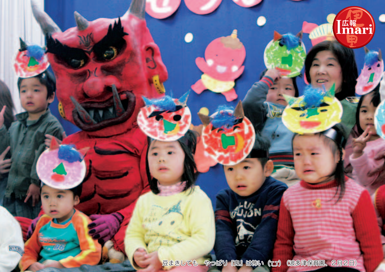
豆まきしても やつぱり『鬼』は怖い (T.T) (波多津保育園、2月2日)