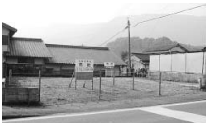
4 山代町楠久字前田557番8の宅地