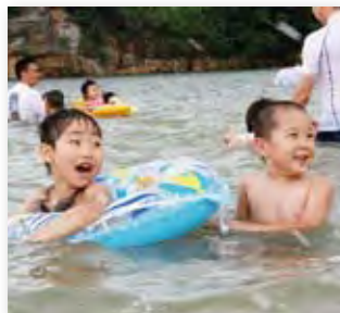
↑イマリンビーチの海開きは7月8日(日)です