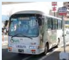
↑すっかり市民に定着した『いまりんバス』