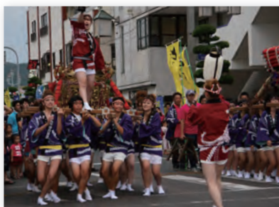
↑今年の『どっちゃん祭り』は、8月5日(日)開催です!