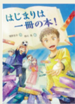
『はじまりは一冊の本!』 濱野 京子/作 森川 泉/絵 あかね書房

父とは趣味が合わない柀斗。同級生の文哉はサッカー、希海は本、悠香はスポーツと、それぞれ好きなものがありますが、柀斗には夢中になれるものがありません。そんなある日、学校の図書館で卒業生が共同で作った『妖精リナーの冒険』という本に出会います。このようにして本を作ったのか。「本とは何か」気になった柀斗は、本について調べていくうちに印刷の歴史にも興味を持ち始め…。