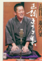
『六代目三遊亭円楽 正調まくら集』 六代目三遊亭円楽/著 竹書房

テレビ番組『笑点』で人気を博しながら、会派にとらわれない落語会のプロデューサーなどを活発に行い、多くのファンに愛されてきた、六代目円楽。この本は、晩年の『まくら』から厳選し、活字化したものです。時事や時節ネタはもちろん、歌丸師匠との思い出や自身の闘病のことなど、まさに命を懸けて落語に向き合った印のような『まくら』の数々。 生前の円楽師匠の小癖が、映像のように蘇ってきます。