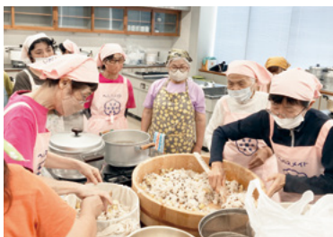
↑養成講座でのひとコマ