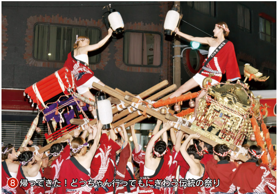
8 帰ってきた！どつちゃん行ってもにぎわう伝統の祭り