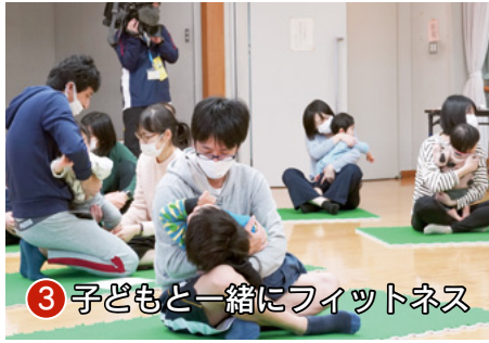
③ 子どもと一緒にフィットネス