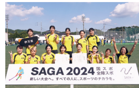
↑3位決定戦では一進一退の攻防を繰り広げ、勝利まであと一歩だった伊万里クラブの皆さん