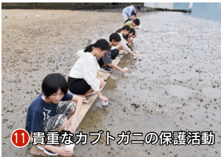
11 貴重なカブトガニの保護活動