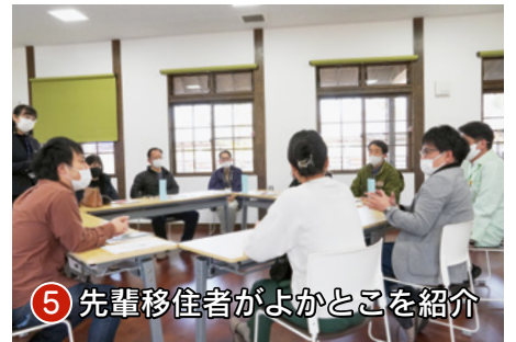
⑤ 先輩移住者がよかところを紹介