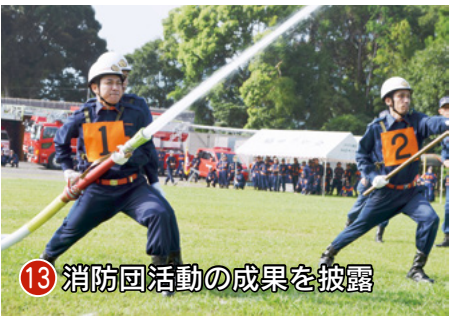
13 消防団活動の成果を披露