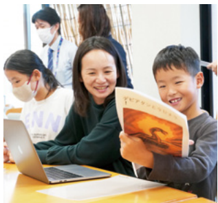
↑できあがった絵本をうれしそうに読む親子