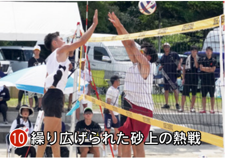
10 緑り広げられた砂上の熱戦