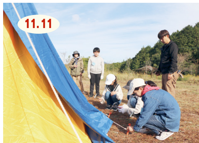
↑慣れない手つきながら、くいを打ち込み、協力してテントを設営する児童たち

伊万里市青少年団体連絡協議会の主催で、都川内森林公園（大川内町）でチャレンジ『Day』キャンプが行われ、市内の小学校4～6年生11人が参加しました。児童たちは、テント設営や火おこし、自然を使ったビンゴゲームなど、日常生活では味わうことが少ないアウトドア体験を満喫し「初めて会った友だちと仲良くなって、協力してテント設営やゲームを楽しめた」と笑顔で話していました。