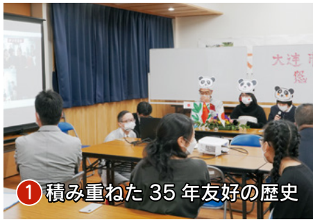
① 積み重ねた35年友好の歴史