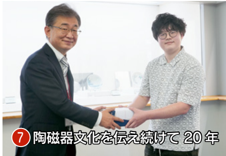
⑦ 陶磁器文化を伝え続けて20年