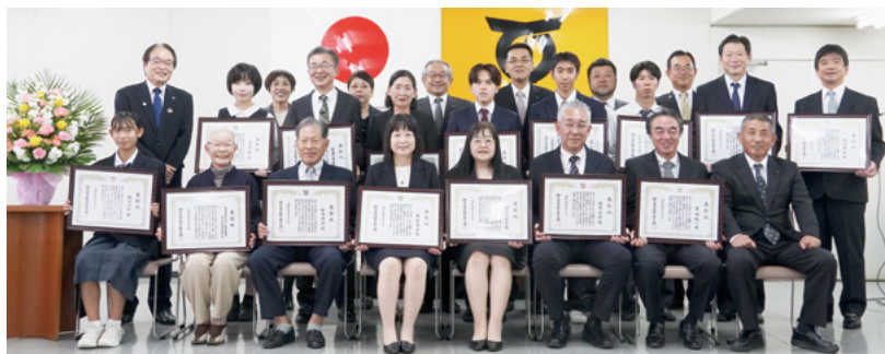
↑市教育委員会表彰受賞者の皆さん（前から1列目と2列目）