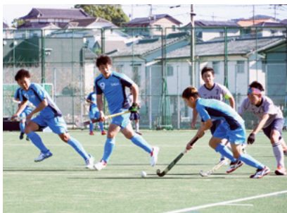
↑男子佐賀県代表のラフテル伊万里ホッケークラブは1回戦で茨城HCに勝利