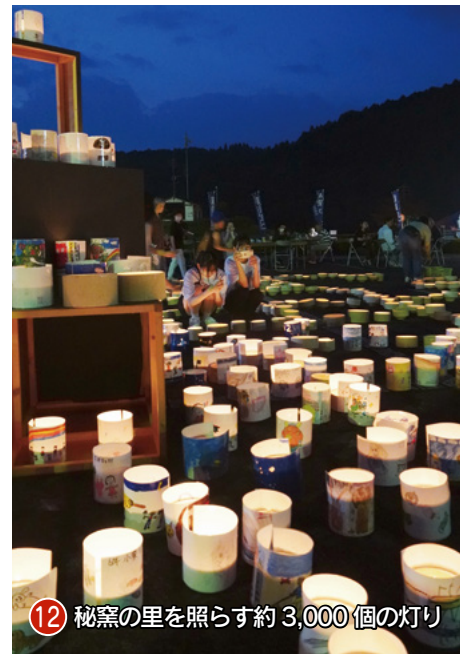
12 秘窯の里を照らす約3,000個の灯り