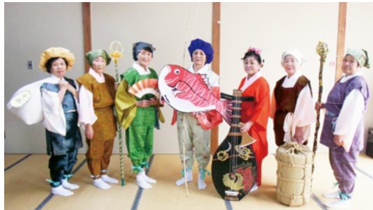
↑手作りした『七福神』の衣装を着たおかめ隊の皆さん