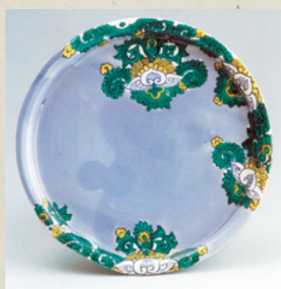
写真① 色絵唐花文皿

ています。伝世品は低く、一般的な皿の高台と同じですが、出土品は鍋島焼の特徴でもある高い高台となっており、のこぎり状の文様（鋸歯文）も描かれています。