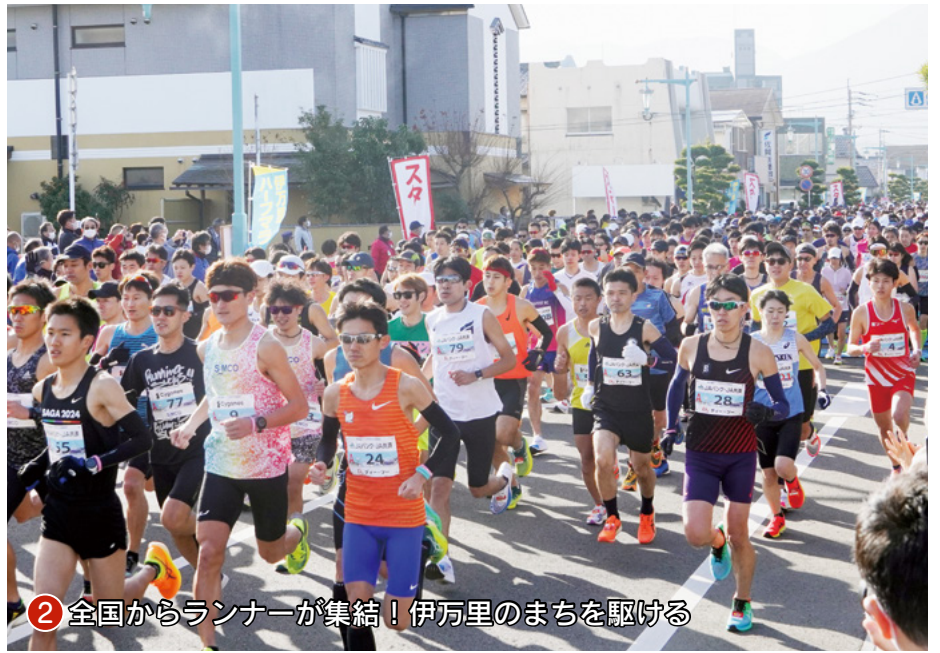
② 全国からランナーが集結！伊万里のまちを駆ける