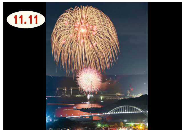
↑約10分間にわたり打ち上げられた三尺玉や5方向からの花火が観客を魅了していました

伊万里の秋を代表するイベントとなった伊万里湾大花火が、今年も伊万里湾で開催されました。4年ぶりに有観客で開催されたこともあって、七ツ島会場（黒川町）では、物産展や花火の観覧を楽しもうと、多くの観客が訪れました。また、昨年8月に供用が開始され、今回初めて観覧会場となった七ツ島大橋でも、多くの観客が三尺玉など次々に打ち上げられる迫力ある花火に歓声を上げていました。