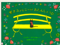
『黒ネコジェニーのおたんじょうび』 エスター・アベリル/作 石津 ちひろ/訳 好学社

今日は小さな黒ネコ、ジェニー！ リンスキーのお誕生日。兄弟たちは、ジェニーをパースティ・ピクニックが開かれる公園に連れていきます。双子のロムルスとレムスや有名な消防ネコのピックルズ、古い友だちのフロリーオも参加します。そしてみんなはピククルズの用意した、はしご車に乗って公園へ。途中でほかのネコたちも集まってきて…。さあ、楽しいパーティーの始まりです。