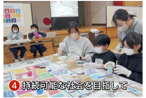
④ 持続可能な社会を目指して