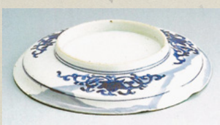
写真② 色絵唐花文皿

鍋島焼は最初、有田で製作していましたが、意匠や技術が漏れないように、また陶工たちを管理するため大川内山に移転しました。高台の低い伝世品は有田時代のもので、大川内山に移転後、高台が高くなったのではないかと考えられますが、今後も調査が必要です。