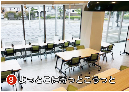
9 よつとこに寄っとうつと