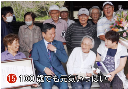
15 100歳でも元気いっぱい