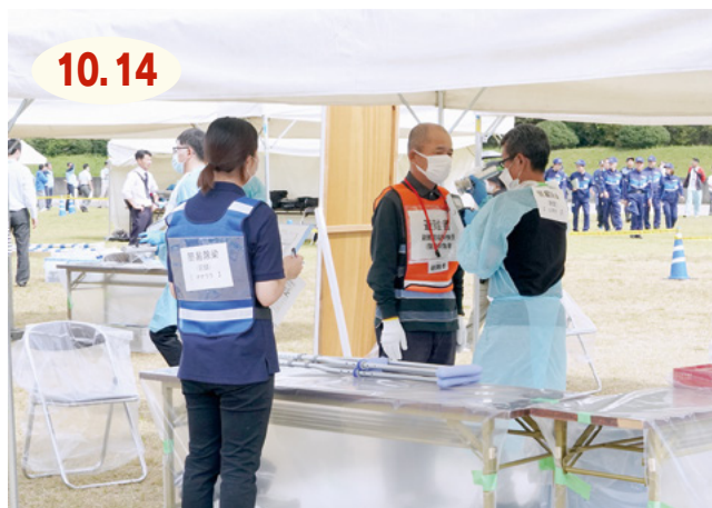
↑参加者は緊張感のある雰囲気の中、放射性物質による汚染検査を体験しました

九州電力株式会社玄海原子力発電所の重大事故を想定した県原子力防災訓練が実施され、松浦町の住民など約100人が参加しました。参加者は、バスや車で武雄市の白岩競技場に移動し、放射性物質による汚染状況を確認する避難退域時検査を受けたあと、嬉野市社会文化会館に避難しました。参加者は一日を通して、避難の一連の流れを確認したり、放射線の基礎知識について学んだりしました。