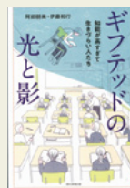
「ギフトテッドの光と影」 阿部 朋美/著 伊藤 和行/著 朝日新聞出版

幼くして語彙力に長けていて、並はずれた記憶力や理解力を備え、生まれながらに高い知能と突出した才能を持つ人々は『ギフトテッド』と称されていますが、特異な才能ばかりが注目され、彼ら彼女らが抱える苦悩や問題は、その影に隠れています。そもそもギフトテッドの定義は難しくその特性が理解されていません。ギフトテッドと呼ばれる当事者やその家族を取材し、日本の社会の在り方や諸外国の取り組みに目を向け実情を探っています。