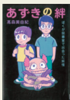
「あすきの絆」 高森 美由紀/作 岩崎書店