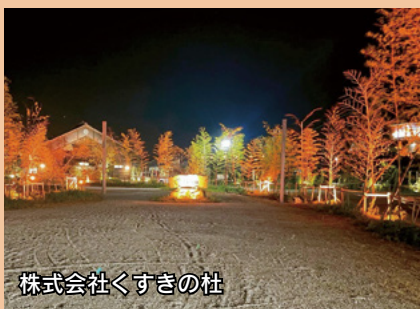
株式会社くすきの社