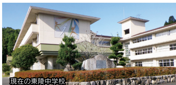
現在の東陵中学校