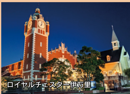
ロイヤルチェスター伊万里

令和4年に全国各地で行われたライトアップの動画をオンライン（YouTube）で観ることができます。→