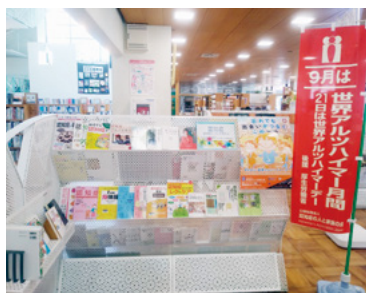
↑市民図書館の特設コーナー

この機会に、認知症への理解を深めて、認知症がある人や認知症がある人を介護する家族などへの支援を考え、認知症になっても安心して暮らせる街にしていきましょう。