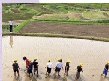
↑二里小学校田植え体験

次は、13日に開催した『二里小学校田植え体験』です。5年生が田植えに挑戦し、悪戦苦闘しながらも丁寧に田植えを行ってくれました。児童の皆さんが一生懸命に植えた苗が今後大きく育ってくれるのを楽しみにしています。