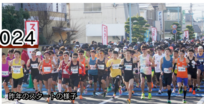
昨年のスタートの様子