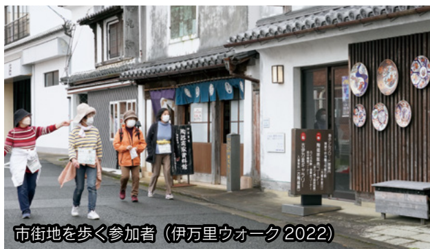
市街地を歩く参加者（伊万里ウオーク2022）