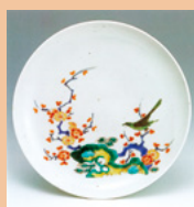
酒井田 柿右衛門 の作品の一つ 『色絵梅鶯文皿』 1600年～1670年代

◆伊万里市民図書館で特設コーナーを設置しています 9月は認知症に関する本の特設コーナーを設置しています。この機会に認知症に関する本を読み、認知症への理解を深めませんか。