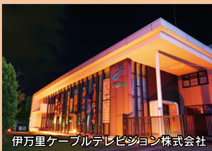
伊万里ケーブルテレビジョン株式会社

アルツハイマーデーの9月21日は、全国各地でライトアップが行われています。皆さんに、認知症に対する関心と正しい理解を深めていただくため、市内の施設でもシンボルカラーのオレンジ色でライトアップされます。