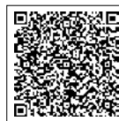
↑応募フォーム はこちらから