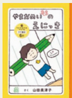
『やまだめいたちのえにつぎ』 山田 美津子/さく 理論社

絵日記の宿題が出ているめいちゃん。だけど、めいちゃんは、どこにも行っていないし、昨日はなんにもなかったし「絵日記、やりたくない!誰か代わりに書いてくれないかなあ」