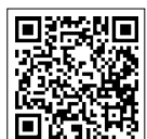
↑なんでも相談 はこちらから