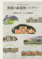
『英国の幽霊城ミステリー』 織守 きょうや/文 エクスナレッジ

妖精や幽霊の伝説が多く残るイギリスでは、有名な城のほとんどに幽霊が出るというから驚きです。その伝説を紐解いていくと、イギリスやそれぞれの城が迎ってきた歴史が見えてきます。6人の妻をもった16世紀の国王ヘンリー8世に処刑された妻たちの幽霊を始め『ハリー・ポッター』のホグワーツ城のモデルとなった城、現在の王室一家が住まうバッキンガム宮殿も登場。建築専門雑誌『建築知識』に連載されたエッセイをまとめています。