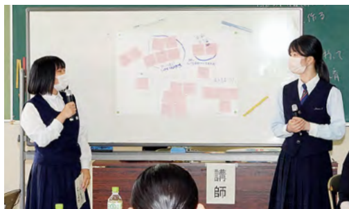
↑緊張しながらも、グループを代表して発表を行う高校生