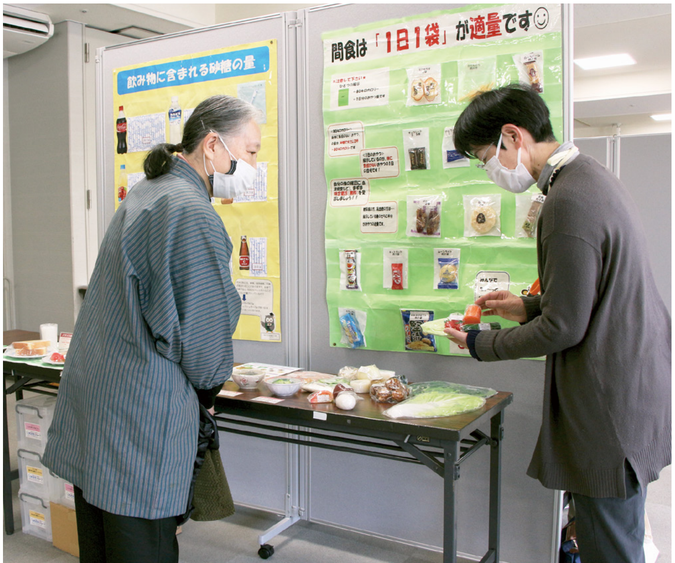
↑ 1日 350 g の野菜の例について説明する保健師（右）