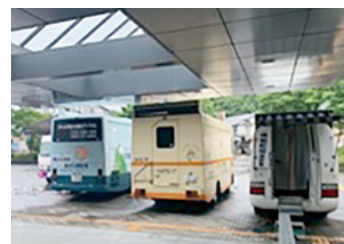
↑屋外の検診車で実施

▷熱が37.5度以上あるときや体調がすぐれないときは、別の日の受診を検討してください。また、予約をキャンセルする場合は、連絡してください。