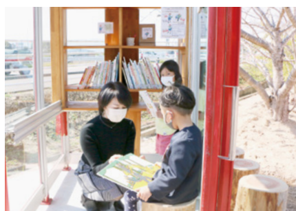
↑木のいすに座って、好きなときに絵本を読むことができます

10月27日、黒川コミュニティセンターで黒川町家読連絡会による『まちかど絵本箱えほんのたね』めばえ式がありました。いつでも、誰でも自由に絵本を読み、借りることができ、絵本箱は、電話ボックスを再利用したものや新たに手作りした小屋の中にあり、500冊以上の絵本が用意されています。この絵本箱は、まちづくりを応援する『さが未来アシスト事業費補助金』を活用し、和歌山県有田川町の『まちかど絵本館』を参