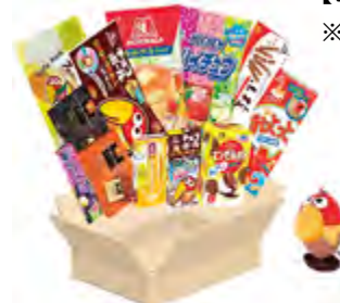
←キヨロちゃんぬいぐるみ