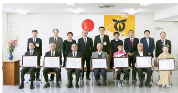
↑市教育委員会表彰受賞者の皆さん