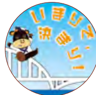
↑オリジナル缶バッジ