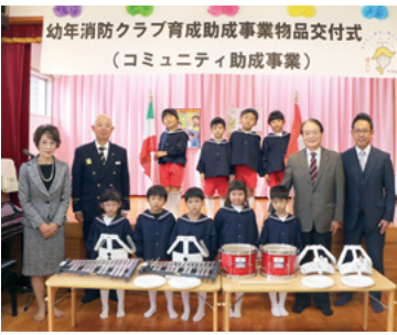
↑交付された太鼓セットなどと園児たち