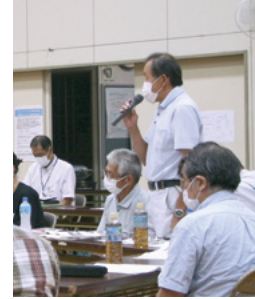
↑ 府招浮立の保存などを説明する市民

関連企業の進出による新たな産業と雇用の創出など、市これまでの取り組みを説明しました。その後、参加した市民は「梨を栽培している。伊万里にはアスパラやきゅうりなどもあり、農業の発展のために、行政と一緒に取り組みを進めていきたい」、「南波多では、地域が一緒になって子どもたちを育てていて、とても良いところである。この良さを大事にしていきたい」など市長と意見を交換しました。 終了後、参加者の一人は「市長と話ができて、とても良い機会だった。自分たちも市の発展のために、行政と一緒に頑張って魅力あるまちづくりに取り組んでいきたい」と話しました。今回のミーティングで寄せられた意見は、今後、市のさまざまな施策において生かしていく予定です。