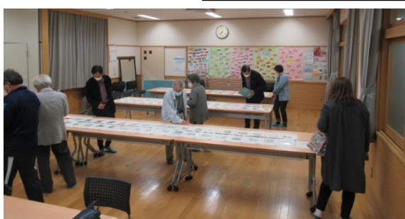
↑絵はがきコンテスト審査会の様子です。力作揃いで審査に苦心されておりました。