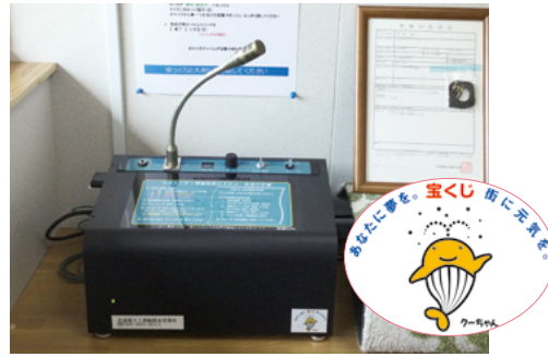
↑整備された無線屋外放送設備