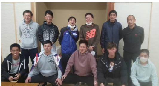
出場された選手の皆さん