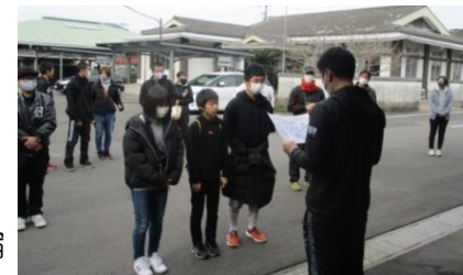
駅伝大会優勝 中組子ども会

優勝 中組子ども会 32分55秒 準優勝 中山・田代子ども会 34分41秒 第3位 辻・野林子ども会 35分17秒 躍進賞 内野・畑津子ども会 1分35秒短縮