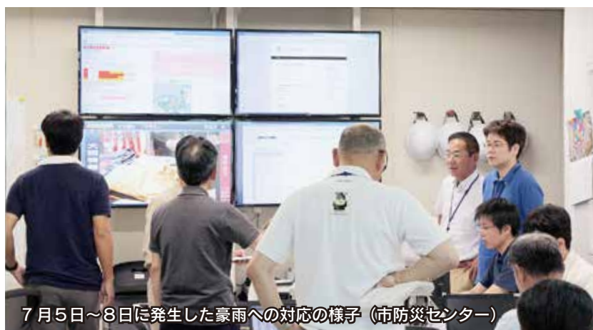
7月5日～8日に発生した豪雨への対応の様子（市防災センター）

地区防災会活動の活性化と住民の防災意識の向上を図るため、地区防災委員を対象とした研修会を開催するとともに、『わがまち・わが家の防災マップ』を活用した地区ごとの防災訓練を実施します。また、中学生を対象として、災害時に主体的に行動