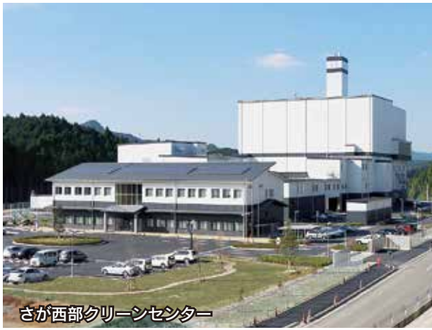
さが西部クリーンセンター