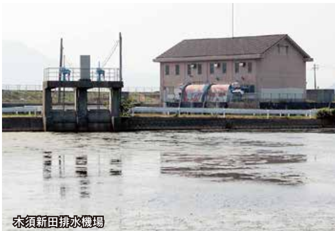
木須新田排水機場