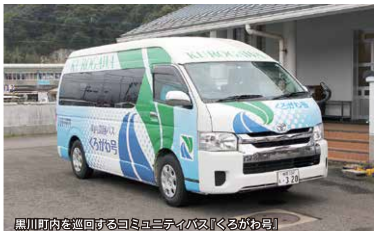
黒川町内を巡回するコミュニティバス『くるがわ号』

第3セクターである松浦鉄道株式会社との円滑な事業運営のため、松浦鉄道沿線の2県4市2町で組織する松浦鉄道自治体連絡協議会において決定した施設整備事業計画に基づき、施設の整備や更新に