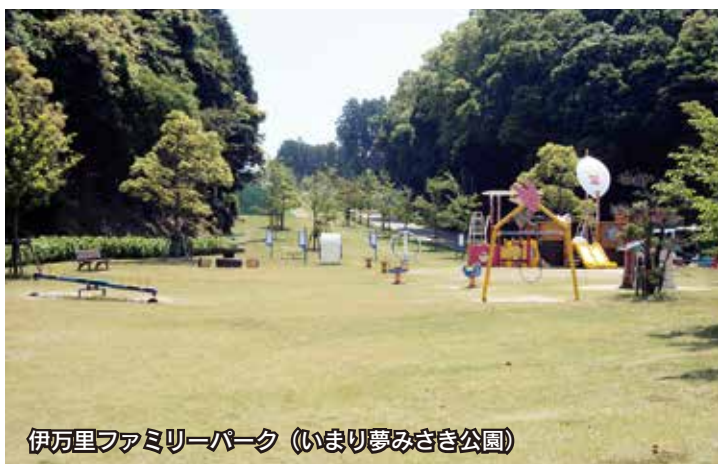
伊万里ファミリーパーク（いまり夢みさき公園）