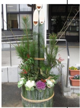
大松川を公設館にまもり立てた派な