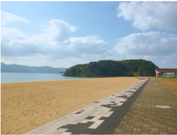
【周辺:イマリンビーチ】