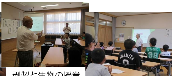
剥製と生物の授業