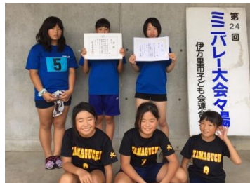
山口子ども会(ミニバレー)