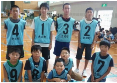
長野子ども会(ドッチビー)

試合結果は、ドッチビーは惜しくも入賞はなりませんでした。ミニバレーは3位と大健闘してくれました。両チームとも大川町の代表として大いに頑張ってくれました。選手の皆さん、応援の皆さん本当にお疲れ様でした。