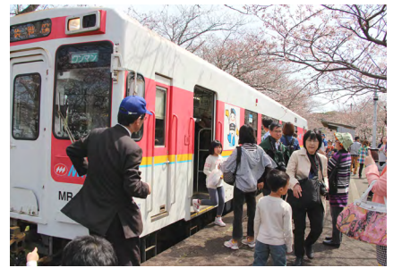
↑松浦鉄道浦ノ崎駅(桜の駅)に降り立ち、まつりに訪れる人たち(昨年の様子)