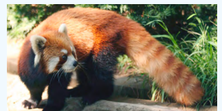
↑夜行性で、感染症を媒介する可能性があるアライグマ