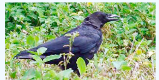
↑観察力と学習能力が非常に高く、好奇心旺盛なカラス