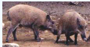
↑警戒心が強く、主に夜間に行動するイノシシ