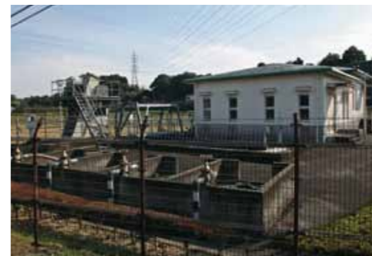
六仙寺導水ポンプ場