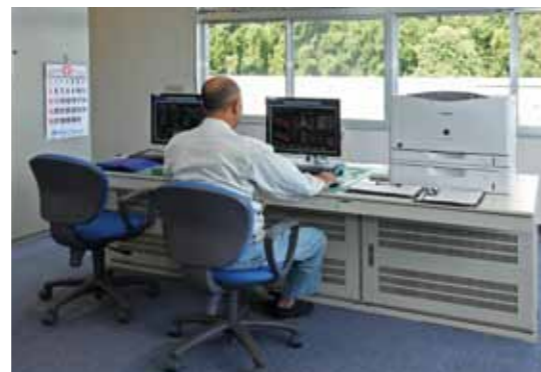
第3工場長浜浄水場中央監視室