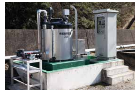
第1工場長浜浄水場PH調整装置