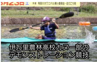
伊万里農林高校カヌー一部のデモンストレーション競技