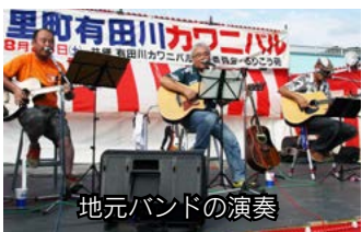
地元バンドの演奏