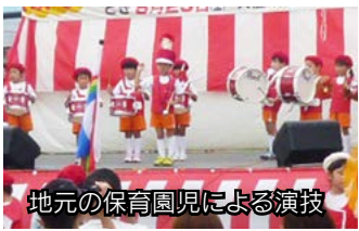
地元の保育園児による演技