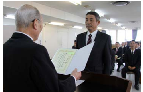
↑当選証書付与式の様子 (4月28日)