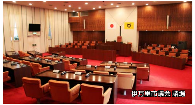
伊万里市議会 議場

※顔写真下の表記は、氏名、年齢、住所（行政区）、所属党派、肩書（現・元・新）、当選回数の順