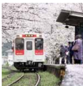
↑満開の桜に彩られた松浦鉄道浦ノ崎駅