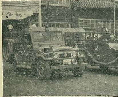
（左が新車右は廃車されたもの）

熊本博へ どうぞ 三月二十日から五月二十日まで（六十二日間）熊本城の再建を記念し、熊本城再建記念躍進熊本大博覧会が開催されますが、この前売券を市経済課で取り扱っておりますのでご利用下さい。