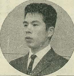
若人の情熱をもつて