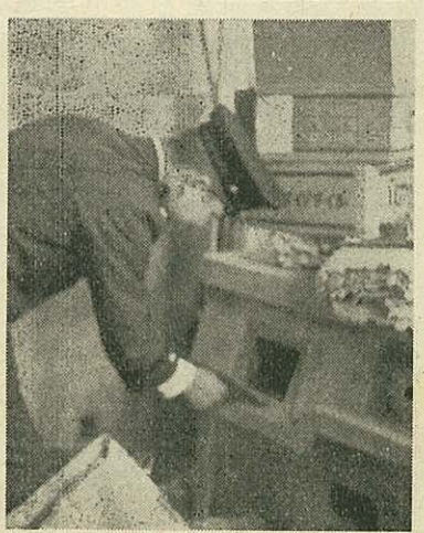
【こんなところが危険です】

日本の建物には、ほとんどが木や紙などが燃えやすいもので造られていて、一度火が出るとつきつきに燃えうつり大火事になりやすいものです。 さる九月二十六日、長崎県福江市で起きた損害百億円の大火は、まだ記憶に新しいのですが、これはたばこの吸が原因といわれています。 このようにどんな大きな火事でも、最初一本のマッチ、あるいは一かけらの火種からであり、火を扱う人がよつと注意しておれば、火事にならなくてもすんだという場合が大部分です。 また、火災は大きくなつてからは消火が非常に困難ですが、小さいうちならばバケツ一杯の水や家庭用の小さな消火器でもたやすく消すことができます。火を使用する場所には必ず消火の準備をしておきましょう。また火災が起きたら自分たちだけで消火しようとして、すぐ消防署や消防機関へ知らせるのがおくれたらめに思われ大火になつた例はたくさんあります。 このようなことが守られると火事はもつと少くなるはずですが、実際にはむしろ増加しており、昨年の火災発生状況をみると、県内では二百四十九件発生し、その損害額は一億五千万円にのぼっています。これを一昨年に比較すると件数で四件、損害額で三千万円増加しており、死者も昨年は死者八名、負傷者は九十三名という多数にのぼりました。 ことしは現在までで発生件数、損害額ともに昨年を上廻り、死者も増加しています。 私たちが日常生活を営むうえで火は欠くことができません。それだけに火を取扱う場所やコンロ、かまどなど火を使用する器具や電気用品などは不良品を使わないように注意し、あやまちや不注意などで火災をおこさないよう十分注意してください。