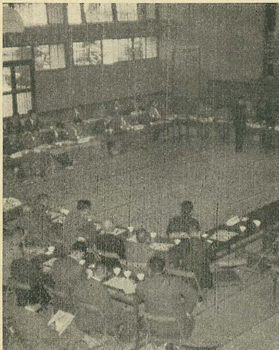
【共存共栄を協議する初の懇談会】

伊万里湾を囲む佐賀、長崎県と伊万里市、松浦市など関係市町村で産業、経済、観光、港湾、交通など共通の問題を協議する初の伊万里湾経済懇談会が伊万里市長、松浦市長の発起で、十月十六日午前十時から伊中体育館で開かれ、次の十数項目の当面の諸問題について討議採決され、県ならびに政府へ書面をもつて強く要望することになりました。主な協議内容は ◎国道の整備促進について (1)唐津、伊万里、松浦、佐賀保線 (松浦市提案) ◎三十七年度に全線の二、三、四十年程度までに完成の予定 ◎福岡、伊万里、有田線(伊万里市提案) ◎四十年までに全線完成見込(佐賀県) ◎県道の整備について (1)伊万里、川内野、松浦県道を大型バスの運行出来る道路の整備 (伊万里、松浦市提案) ◎現在計画はないが丸炭事業として取上げたい(佐賀県) ◎鉄道について (1)伊万里、呼子、唐津鉄道の早期着工(伊万里市、玄海町前町提案) ◎関係当局へ地元協議会から強力に陳情を行っているが、なお県と地元市町村が一体化し長崎県の側面的な協力を(佐賀県) ◎伊万里、呼子線(伊万里市提案) ◎工場地帯を一貫する道路網を計画調査推進中である(佐賀県) ◎筑前線、松浦線の準急増発及び快速列車の復活(伊万里市提案) ◎地元と県が一体となって関係当局に早期解決に努力中である。 ◎福島橋建設促進について (福岡市提案) ◎県当局は公共事業三年計画に決定、離島振興など適用、近く関係知事が会談して推進したい