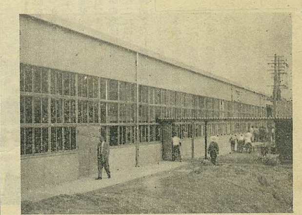
開所された伊万里総合職業訓練所

年金だより 昨年四月に算定期間が二十年以上であること。 例えは、厚生年金の期間が十二年、公務員共済組合の期間が八年の場合合せて二十年であるから、国民年金は一年以上の期間に達して、それぞれの制度によって三種の年金が支給されます。 一 他の公的年金による老令、退職年金の給付を受けることができること。 例えは、他の制度による老令年金、退職年金の給付の資格要件を満たしている人は、既に給付を受けている人は、国民年金の期間が一年以上で支給されます。この制度の制定によって国民のすべてが年金の支給 国民年金保険料納付済期間 通算年金 通則法について 料納付済期間と国民年金の期間を合算した期間、または保険料免除期間が一年以上である人が次の各号に該当するときに支給されます。 一 国民年金と他の公的年金との期間を合算した期間が二年以上であること 例えは、厚生年金の期間が十九年のときは、国民年金の期間が六年以上であれば期間に応じ、それぞれが支給されます。 二 一 他公的年金に係る通算