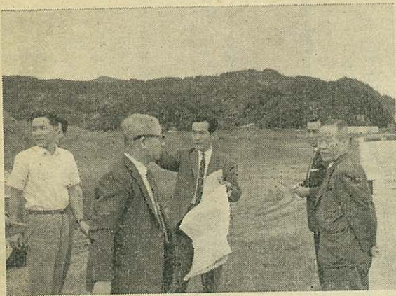
敷地調査の社長一行

ラクダ産業は、内需および輸出向けラクダ印合板の製造、販売やプレハブ建築の設計施工、ハードボードその他新しい建築材料の販売を行なっている会社である。同社の伊万里進出の動機は、総合木材工場の主原料である原木(フィリピン、ボルネオなど)から輸入する