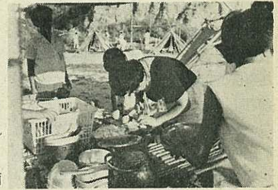
キャンプの料理はみんなで楽しく

青少年団体の指導者・青年団員・小中学生などが、団体で2泊3日ずつ交替して500人参加しました。