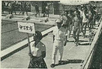
県体水泳競技入場式