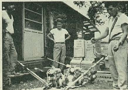
市森林組合が購入した下刈り機

下刈り機・自動のこぎり・植穴掘機など造林用の機械も森林組合で購入し、組合員に貸付けることになっています。