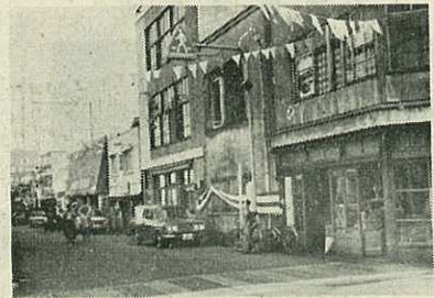
標識灯がつけられた中央通り四つ角

この標識灯は、県内で初めて設けられるものです。400ワットの黄色水銀灯1個と20ワット蛍光灯2個が取り付けられており、歩道をくっきり浮かびあがらせ、交通事故防止に一役かっています。