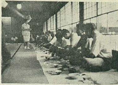
【写真】盛会だった肥前陶磁器入礼会