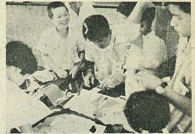
【写真】団員から学習を受ける生徒

伊万里市農業委員会の委員定数は29人(選挙による委員20人は、本紙8月号で記載済み)です。