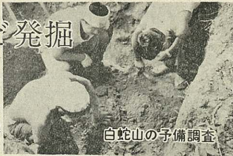
白蛇山の予備調査

現場からは、黒よう石の矢じりなどが発掘され、縄文中期の住居跡ではないかと見られています。