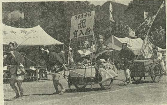
宝船も出た漁民体育大会

9月から10月にかけて各町で町民体育大会が開かれています。波多津町では、ことし、初めて漁民体育大会も開かれました。