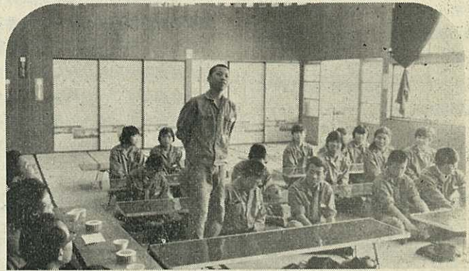
開講式で自己紹介をする東洋プライウッドの従業員

勤務の都合で学級生18人を2班にわけ、社会人として、青年としての立場を考えて行くことにしています