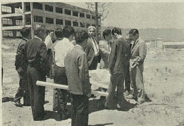
市庁舎建設審議会、六月十日 立花台地で市執行部の説明を受ける

の将来に大きな影響を及ぼすことから市議会・建設審議会・市長に対して、市民から賛否両論の陳情・要望がなされており、会議を傍聴する市民も多く、白熱した審議が続けられています。審議会では、次のような意見が出ました。