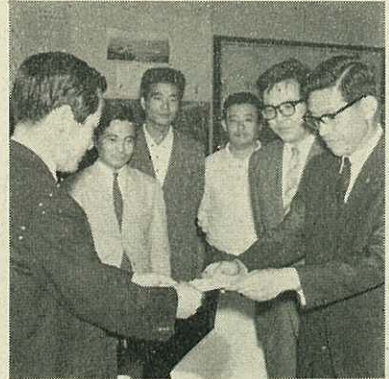
竹内助役に寄付金を渡すJ.C代表

同町青年団は、この工事で得た賃金のうち1万7,000円を、6月7日十勝沖地震の見舞金として市社会福祉協議会に委託しました。