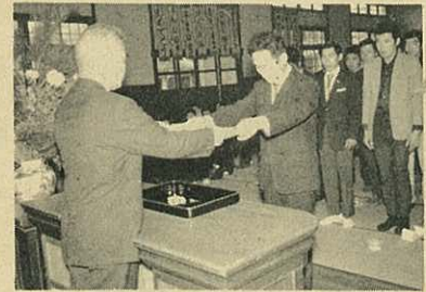
▷大工さんの卒業式◁

建築工学や設計のほかには社会人としての教養を身につけるため、社会体育・数学なども学習しています。