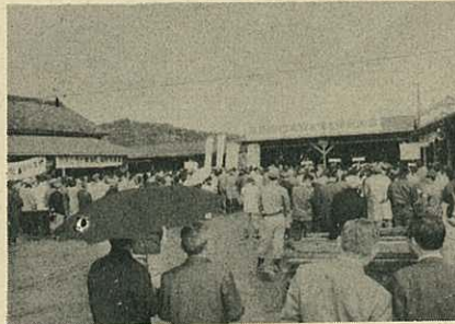
▷合理化反対を決議する市民大会◁