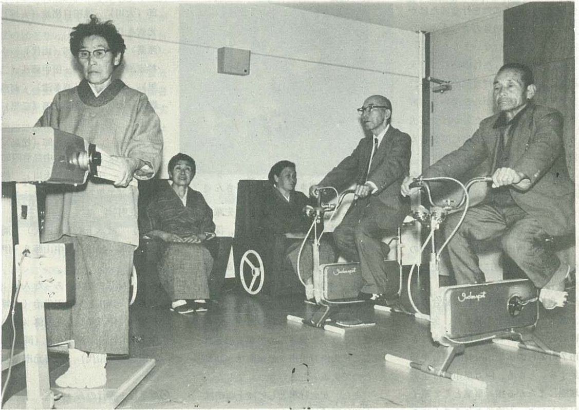
——オープンした老人福祉センター「ことぶき荘」——