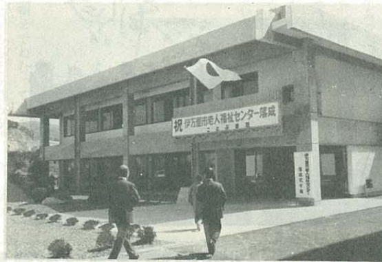
▷利用者あいつぐ「ことぶき荘」◁

このセンターは、おとしよりの長寿を祝って「ことぶき荘」と名づけられ、すでに4月15日から開館しお