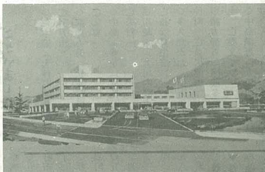
▷市役所の完成よう図◁

人たちがはいることになっています。さらに、本館1階にはひろびろとしたジュタンをしきつめた市民の休けい室もつくりまします。