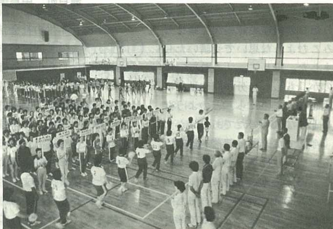
▲ママさんのナイターバレーボール大会 今年からママさんのナイターバレーボール大会が始まりました。出場は24チーム 試合は8月8日までの予定です。(国見台体育センター7.4)