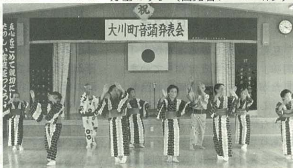
▲大川町音頭の発表会 “町民の心を一つにする音頭をつくろう”との要望から大川町音頭ができ、婦人会・老人クラブなど200人が集まって発表会(7.11)