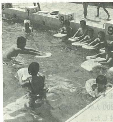
▲これで安心して泳げます “ぜひとも泳げるようになりたい”と自称カナヅチの婦人30人が5日間の特訓に励みました。これで泳ぎは万全です。(国見台プール 7.9)