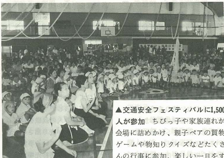
▲交通安全フェスティバルに1,500人が参加 ちびっ子や家族連れが会場に詰めかけ、親子ペアの買物ゲームや物知りクイズなどたくさんの行事に参加、楽しい一日をすごしました。(国見台体育センター7.9)