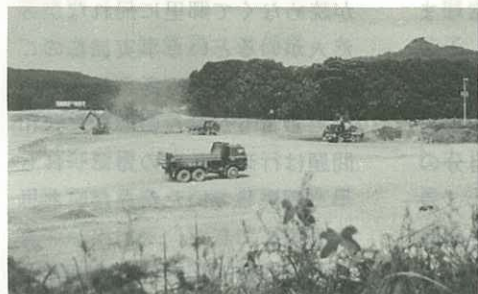
▲県立養護学校来春開校めざし急ピッチ 旧県畜産試験場跡地(大川内町平尾)に養護学校の建設工事が急ピッチで進められており、順調にいけば来年4月に開校します(7.24)