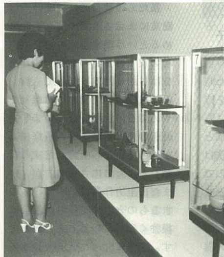
▲9月4日まで高麗窠跡出土品展 市歴史民族資料館で出土品の完品、陶片合わせて240点を展示しています。無料です(7.24)