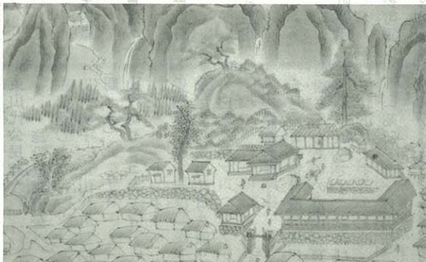
▲鍋島藩の絵図大皿から（部分）

市は、市内の郷土研究会の方たちや市民の皆さんと十分話し合い計画を具体化していきます