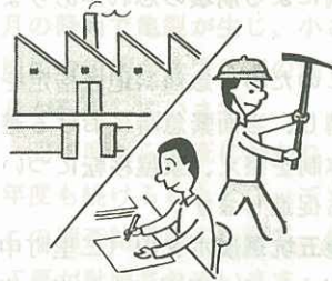
工場も店舗も会社も学校も 6月15日 事業所統計調査

この事業所統計調査は、国勢調査とならぶ国の基本的な調査です。ご協力をお願いします。