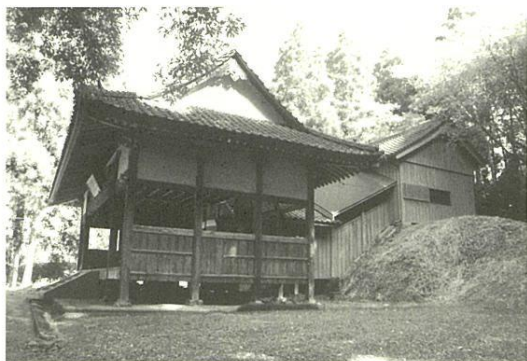
左より拜殿・幣殿・本殿（覆殿）

た江戸中期作成の「伊万里郷古地図」に「豊姫社」として絵図入りで記載されています。また ※記紀Ⅱ日本最古の歴史書である古事記と日本書紀