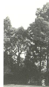
拜殿前の庭はゲートボール場となつ

記紀神話の神を祀る古社で、創建年代は明確ではありません。また せんが、明和四年(一七六七)銘の棟札が現存しています。ま