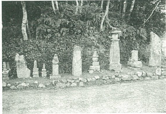
上分劔ギの石塔婆群