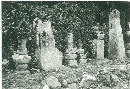
供養塔と寄せ仏〔五輪塔・法篋印塔〕

供養塔 五輪塔の左側に三基の供養塔が並んで立っています。左端の塔には梵字の下に「為権少僧都快長」と刻まれ、高さが約一メートル一〇センチ、幅が上部三五センチ下部五三センチの凹凸のある形の自然石の塔になっています。建立紀年は剥離したのか見当りません。刻字に権少僧都と付されているので、