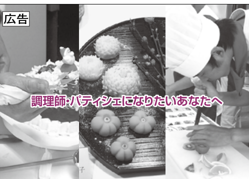
調理師:パティシエになりたいあなたへ