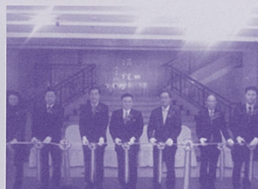
中国瀋陽事務所開所式(10.26)

佐賀県の海外拠点は3ヶ所となりました。さらに今年1月からは、佐賀—上海間に航空便が就航しました。これらにより中国と佐賀県との間で経済・人の交流が促進され、観光客の行き来や伊万里港の貿易拡大などに期待が寄せられています。