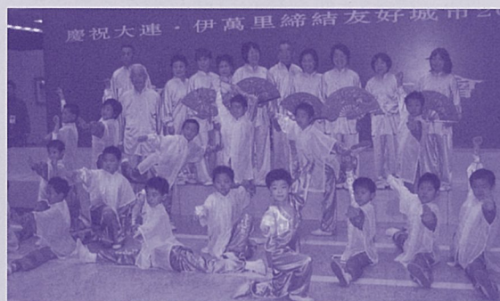
友好交流20周年記念訪問団の交流の様子

☆今年、友好交流25周年を記念して、市民による大連市訪問計画されています。参加者募集等は、広報でお知らせがあります。