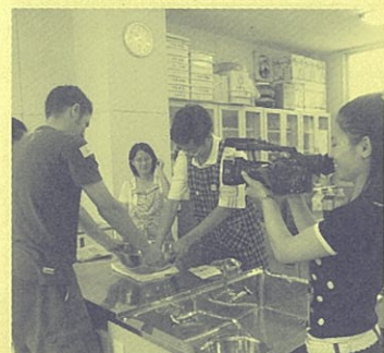
交代でナン生地をこねる。

7月12日(日)、伊万里市国際交流協会の主催により中国・アメリカ・カナダ等、外国籍の住民8人と会員等が焼ものを通じた体験交流を行いました。皆でナン生地をこね、直火で焼く棒巻きパンを焼いたほか、唐津焼窯元今岳窯のご協力で陶器の成形にも挑戦。