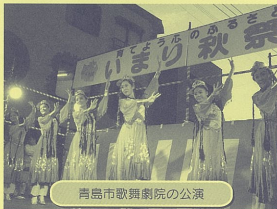
青島市歌舞劇院の公演