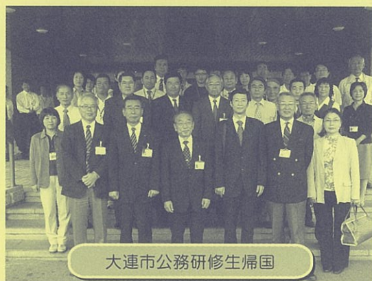
大連市公務研修生帰国