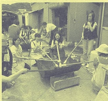
棒巻きパンを焼いて食べる。