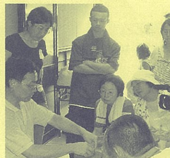
粘土の扱いを学ぶ。